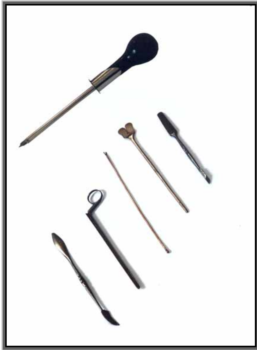
Zbirka zubarskih instrumenata