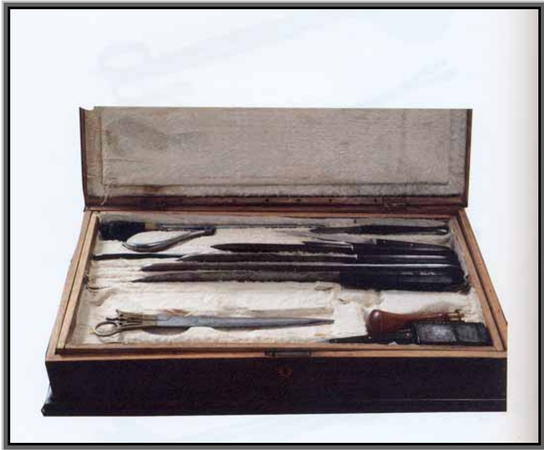
Drvena ukrašena kutija s dva seta kirurških instrumenata