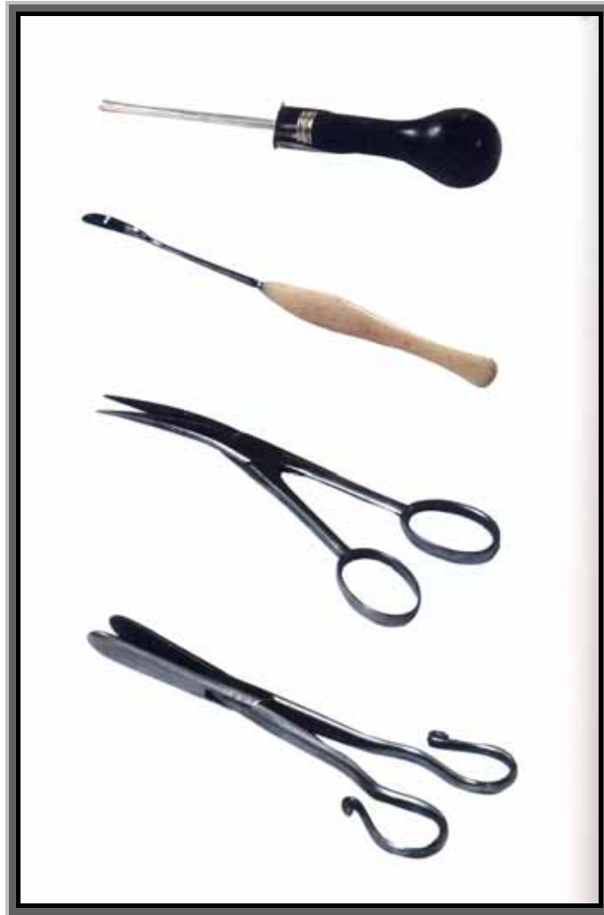
Zbirka kirurških instrumenata