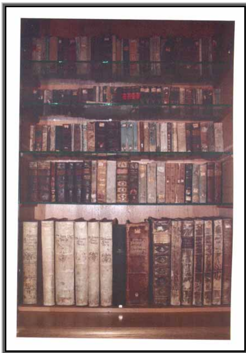
Medicinska literatura dr. Fra Mihovila Sučića u Franjevačkom muzeju i galeriji Gorica Livno

U livanjskom Franjevačkom muzeju i galeriji kao trajna i draga uspomena na tog u svom poslu neumorna liječnika i kirurga čuvaju se: kožna torba sa zubarskim instrumentima, apotekarskom vagom, žljebastom sondom, iglama za punkciju i noževima; zatim kirurški instrumenti, anatomski atlas iz 1838. godine i 60 tomova stručnih knjiga na latinskom i talijanskom jeziku.