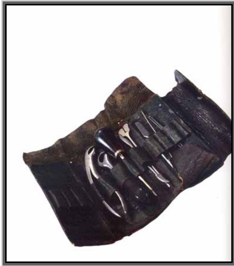
Komplet zubarskih instrumenata (kožni euti)