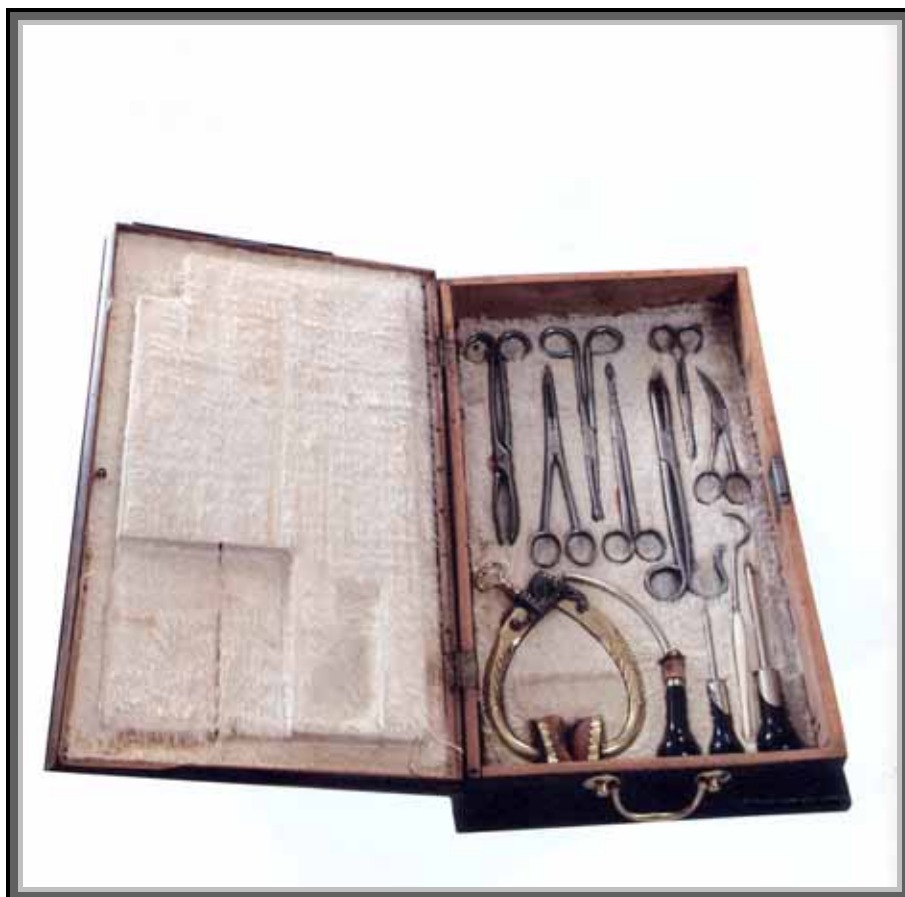
Drvena ukrašena kutija s dva seta kirurških instrumenata. Gornji set sadrži instrumente za venepunkciju, zavijenu iglu za ulazak u prsnu šupljinu, hvataljke za meka tkiva, škare

Povijest liječništva u Bosni, uz ljekaruše kojima su se bavili bosanski franjevci, obilježena je i likom fra Mihovila Sučića. Dr. fra Mihovil Sučić, liječnik i teolog, u svom je liječničkom djelovanju primjenjivao suvremene metode liječenja, služio se suvremenom medicinskom literaturom i instrumentarijem u izoliranim bosanskim vrletima. Analizirajući njegovo liječničko djelovanje, može se reći da je fra Mihovil Sučić, liječnik i kirurg, u bosansko-hercegovačkoj zdravstvenoj zaštiti načinio prekretnicu, budući da je on zdravstvenu zaštitu podigao na znanstvenu razinu. Unatoč teškim i nemirnim vremenima u kojima je živio i djelovao dr. fra Mihovil Sučić, vremenima ispunjenim nepovjerenjem i podjelama, s jasnom granicom između pojedinih naroda i vjera, on je istraživač koji je vođen radoznalošću, koji je spreman na profesionalni izazov, koji se upušta u nove zahvate, koji liječi i pomaže svim bolesnicima bez obzira na njihovu vjeru, spol ili socijalni status.