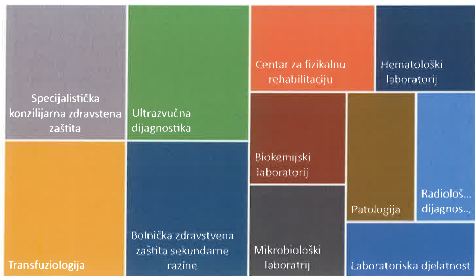
Graf 1 Program bolničke zdravstvene zaštite za 2020. godinu

Javna ustanova nema uspostavljen sustav internog računovodstva na osnovu kojeg bi bilo moguće izračunati osnovne financijske kategorije po korisniku zdravstvene zaštite. Stoga smo ovaj izračun obavili posredno.